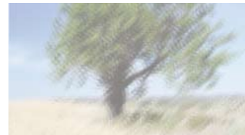
Wird eine vorbestehende Hornhautverkrümmung nicht korrigiert, bleibt das Bild verzerrt und unscharf.