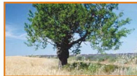
Wird eine AcrySof® Toric-Kunstlinse eingesetzt, ist der Baum ohne Brille scharf erkennbar.